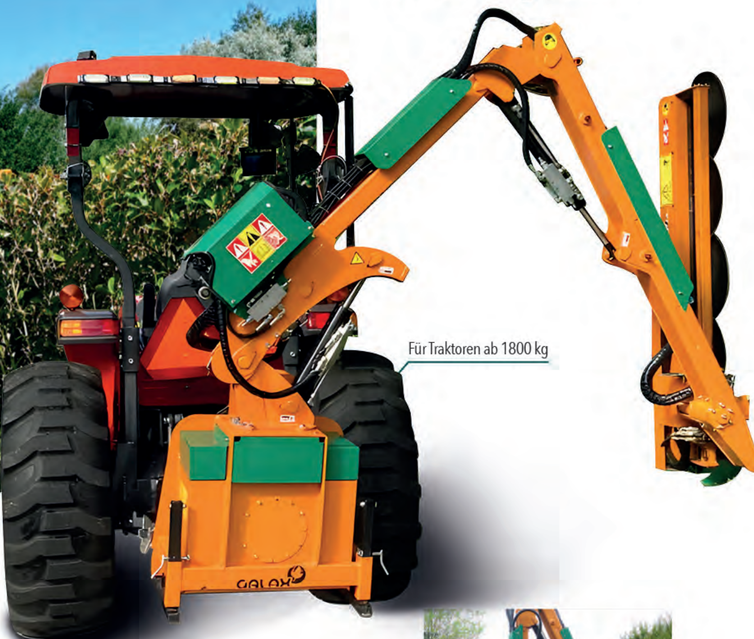
Für Traktoren ab 1800 kg